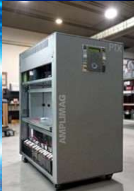
NOBREAK DUPLA CONVERSÃO TENSÕES E/S: TRIFÁSICO 380VCA MARCA: AMPLIMAG MODELO: PTX-3 / POTÊNCIA: 60KVA CARGA: EQUIPAMENTOS ESSENCIAIS DO CENTRO DE OPERAÇÃO 04

SETOR: CALL CENTER SERVIÇOS: INSTALAÇÕES, MANUTENÇÕES CORRETIVAS E PREVENTIVAS