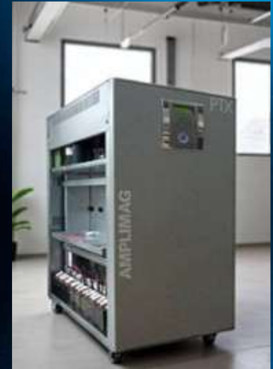
NOBREAK DUPLA CONVERSÃO TENSÕES E/S: TRIFÁSICO 380VCA MARCA: AMPLIMAG MODELO: PTX-3 / POTÊNCIA: 60KVA CARGA: EQUIPAMENTOS ESSENCIAIS DO CENTRO DE OPERAÇÃO 03