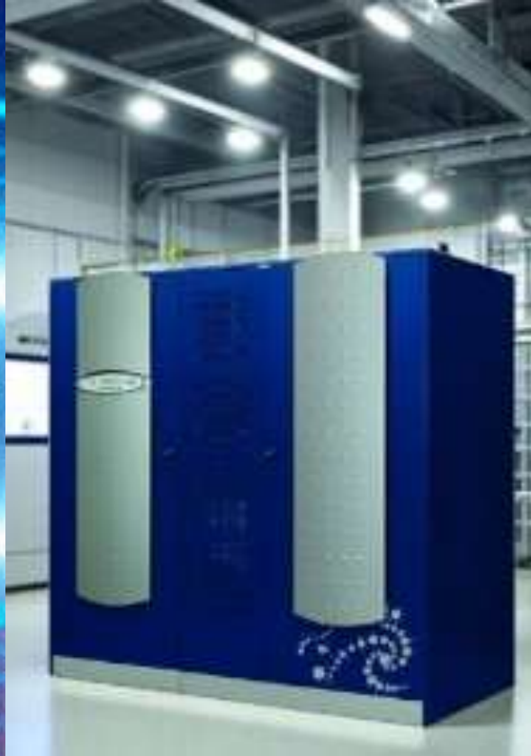
NOBREAK DUPLA CONVERSÃO TENSÕES E/S: TRIFÁSICO 380VCA MARCA: ASTRID MODELO: TX / POTÊNCIA: 400KVA CARGA: EQUIPAMENTOS ESSENCIAIS DAS ALAS 01 E 02 DO ESTÁDIO

SETOR: COMPLEXO ESPORTIVO SERVIÇOS: MANUTENÇÃO CORRETIVA