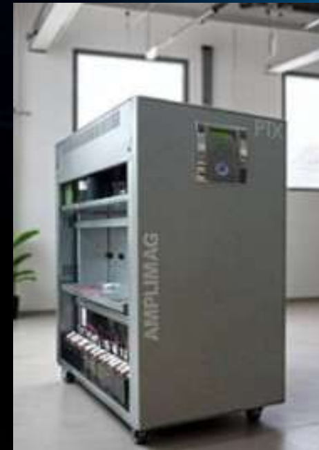
NOBREAK DUPLA CONVERSÃO TENSÕES E/S: TRIFÁSICO 380VCA MARCA: AMPLIMAG MODELO: PTX-3 / POTÊNCIA: 60KVA CARGA: EQUIPAMENTOS ESSENCIAIS DO CENTRO DE OPERAÇÃO 05