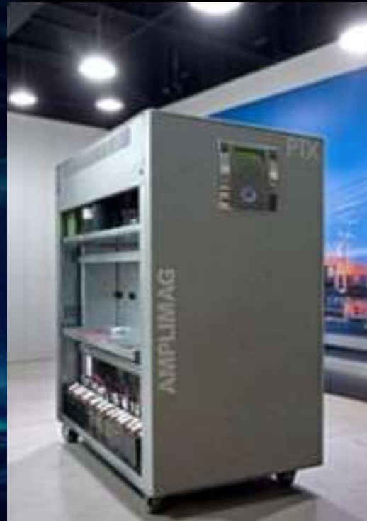
NOBREAK DUPLA CONVERSÃO TENSÕES E/S: TRIFÁSICO 380VCA MARCA: AMPLIMAG MODELO: PTX-3 / POTÊNCIA: 60KVA CARGA: EQUIPAMENTOS ESSENCIAIS DO CENTRO DE OPERAÇÃO 02