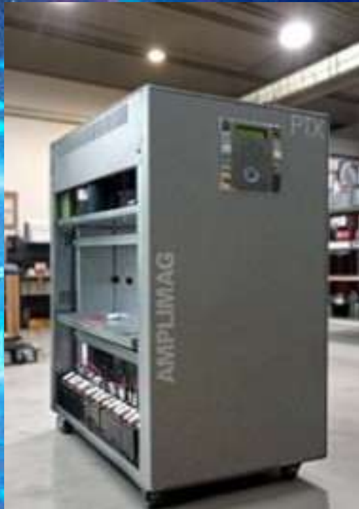
NOBREAK DUPLA CONVERSÃO TENSÕES E/S: TRIFÁSICO 380VCA MARCA: AMPLIMAG MODELO: PTX-3 / POTÊNCIA: 60KVA CARGA: EQUIPAMENTOS ESSENCIAIS DO CENTRO DE OPERAÇÃO 01

SETOR: CALL CENTER SERVIÇOS: INSTALAÇÕES, MANUTENÇÕES CORRETIVAS E PREVENTIVAS