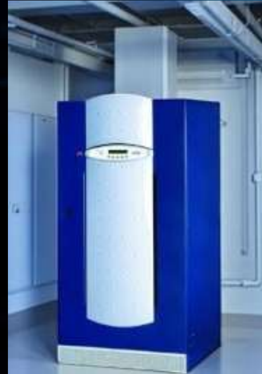
NOBREAK DUPLA CONVERSÃO TENSÕES E/S: TRIFÁSICO 380VCA MARCA: ASTRID MODELO: TX / POTÊNCIA: 100KVA CARGA: EQUIPAMENTOS ESSENCIAIS DAS ALAS 03 E 04 DO ESTÁDIO