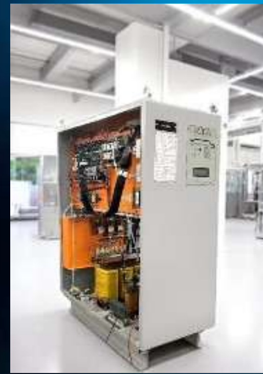
NOBREAK DUPLA CONVERSÃO TENSÕES E/S: TRIFÁSICO 220VCA MARCA: RTA MODELO: BR20T / POTÊNCIA: 20KVA CARGA: EQUIPAMENTOS ESSENCIAIS DO SETOR DE PRODUÇÃO 03