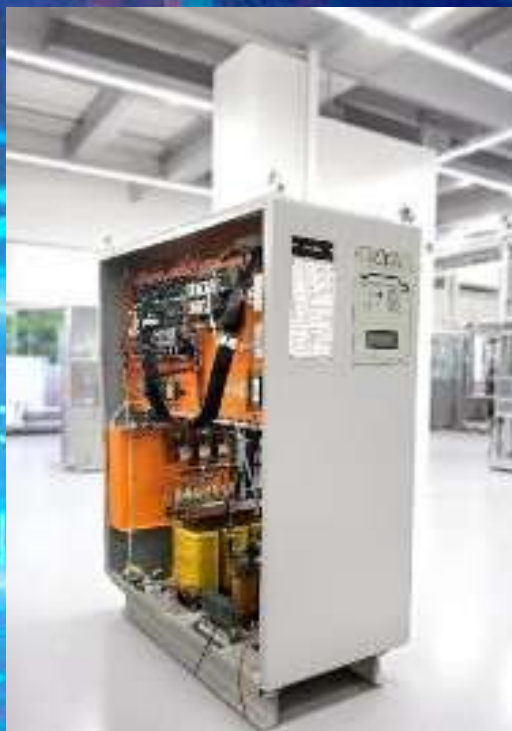
NOBREAK DUPLA CONVERSÃO TENSÕES E/S: TRIFÁSICO 220VCA MARCA: RTA MODELO: BR20T / POTÊNCIA: 20KVA CARGA: EQUIPAMENTOS ESSENCIAIS DO SETOR DE PRODUÇÃO 01

SETOR: INDUSTRIAL SERVIÇOS: INSTALAÇÃO, MANUTENÇÕES CORRETIVAS E PREVENTIVAS