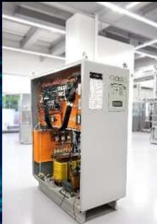
NOBREAK DUPLA CONVERSÃO TENSÕES E/S: TRIFÁSICO 220VCA MARCA: RTA MODELO: BR20T / POTÊNCIA: 20KVA CARGA: EQUIPAMENTOS ESSENCIAIS DO SETOR DE PRODUÇÃO 02